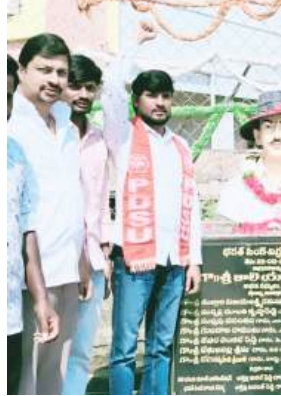
గోల్కొండ టైమ్స్, చేపెట్ :

ఖాళీ ఉద్యోగాలను భర్తీ చేయాలని డిమాండ్ పిడిఎస్ యు నాయకులు