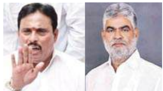
గోల్కొండ టైమ్స్, తెలంగాణ బ్యూరో :

వీడని పార్టీ ఫిరాయింపులు కేసు దానం నాగేందర్ కు తప్పని చిక్కులు స్పీకర్ తీర్పును కొట్టివేయాలని పిటిషన్ దానంతో సహా స్పీకర్ కు హైకోర్టు నోటీసులు