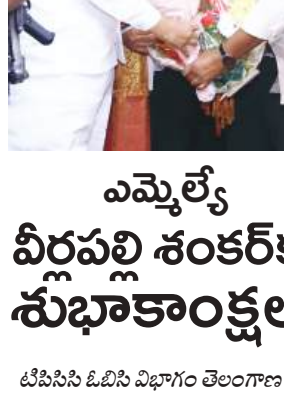
గోల్కొండ టైమ్స్, చేపెట్ :

నిందితులను వెంటనే లిమాండ్ కు తరలించాలి : ఎంజిఎఫ్