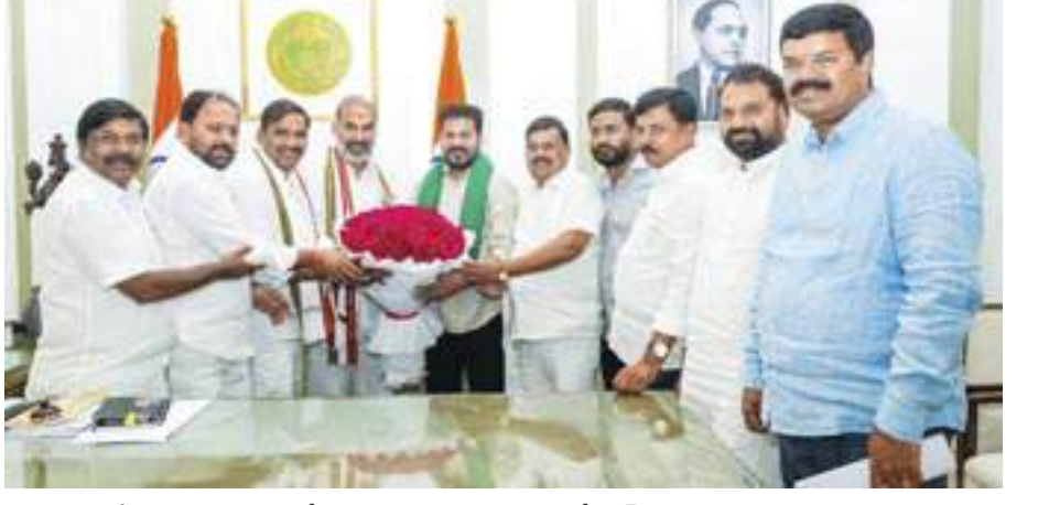
రైతు భరోసా నిధులు విడుదల చేసిన సందర్భంగా ముఖ్యమంత్రి రేవంత్ రెడ్డిని కలిసి ధన్యవాదాలు తెలిపిన శాసన మండలి, శాసనసభ ప్రభుత్వ ఏసీలు, సలహాలు ఎమ్మెల్యేలు, ఎమ్మెల్యేలు.

రించిన రాష్ట్ర సమగ్రాభివృద్ధికి ఉద్దేశించిన తెలంగాణ రైజింగ్ ద్వారానికే ఈ సందర్భంగా సీఎం సభముందు సమగ్రంగా వివరించారు. సీఎం వ్యాఖ్యలు ఆయన మాటల్లోనే..