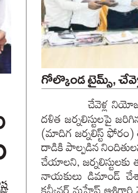
గోల్కొండ టైమ్స్, చేపెట్ :