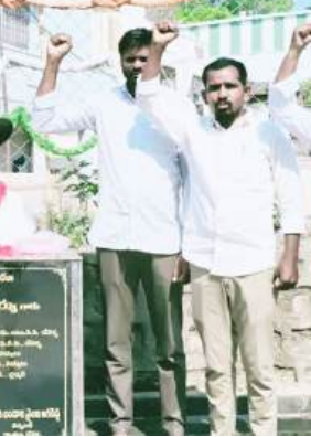
సమానత్వానికి విద్యే బాట