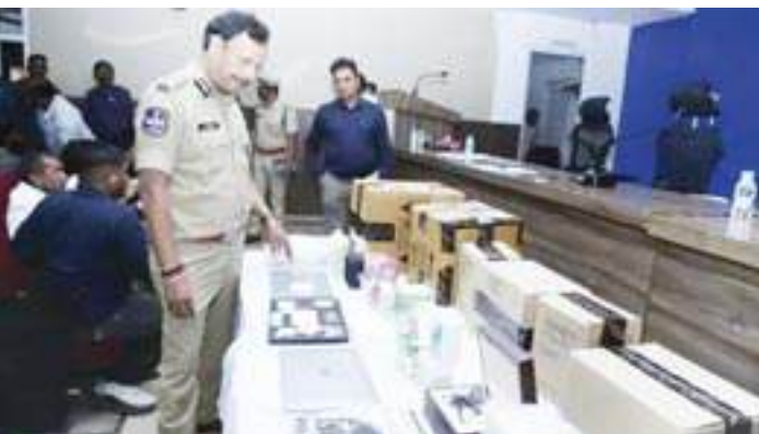
గోల్కొండ టైమ్స్, హైదరాబాద్ :